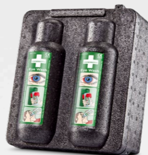
CEDERROTH VÄRMESKÅP REF 790400

Värmeskåpet är avsett för förvaring av två flaskor Cederroth Ögondusch i kalla miljöer. Skåpet håller ögonduschväskans temperatur på +20°C vid omgivande temperatur ned till -20°C. Det fungerar automatiskt vid både 12V och 24V utan ytterligare tillbehör (med transformator även vid 230 V). Stickpropp för cigarettändaruttag i bilar och lastbilar. Spännings-vakt. Elsäkerhetstest och CE-märkt. Ögondusch beställs separat (REF 725200).