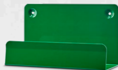
CEDERROTH VÄGGHÅLLARE REF 190400

Ger extra stöd vid placering i skakig miljö, t.ex. lastbilar och truckar.