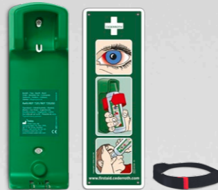
CEDERROTH VÄGGHÅLLARE REF 7200

Hölster i grön nylon med bälteshålla till Cederroth Ögondusch i fickmodell (REF 7221). Mått: B 8 x H 16 x D 4,5 cm.