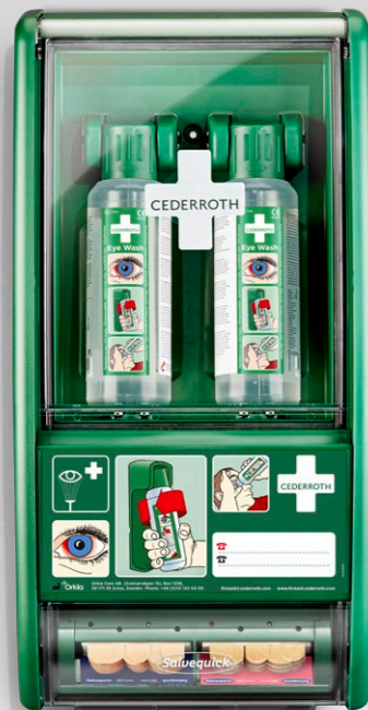
CEDERROTH ÖGONDUSCHSTATION REF 721500

Innehåller: 2 Cederroth Ögonduschflaskor à 500 ml (REF 725200) 1 Salvequick Plåsterautomat inkl. 45 Salvequick Plastplåster (REF 6036) 40 Salvequick Textilplåster (REF 6444) 1 Ögondusch-instruktion 1 Refillnyckel