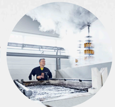
VERKSTAD & INDUSTRI