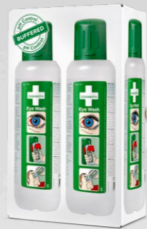
CEDERROTH ÖGONDUSCH REF 725200

Självhäftande skylthållare i plast för montering som flaggskylt.