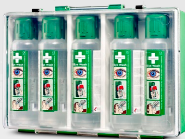
CEDERROTH ÖGONDUSCHVÄSKA REF 7255

2 st (x 500 ml) steril buffrad isoton saltlösning utan konserveringsmedel för engångsbruk. Flaskans mått: 6,5 cm x 23,5 cm. Hållbarhetstid 4,5 år.