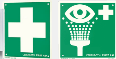
SKYLТ FÖRSTA HJÄLPEN-KORS REF 1738

Dubbelsidig och efterlysande. 20 x 20 cm.